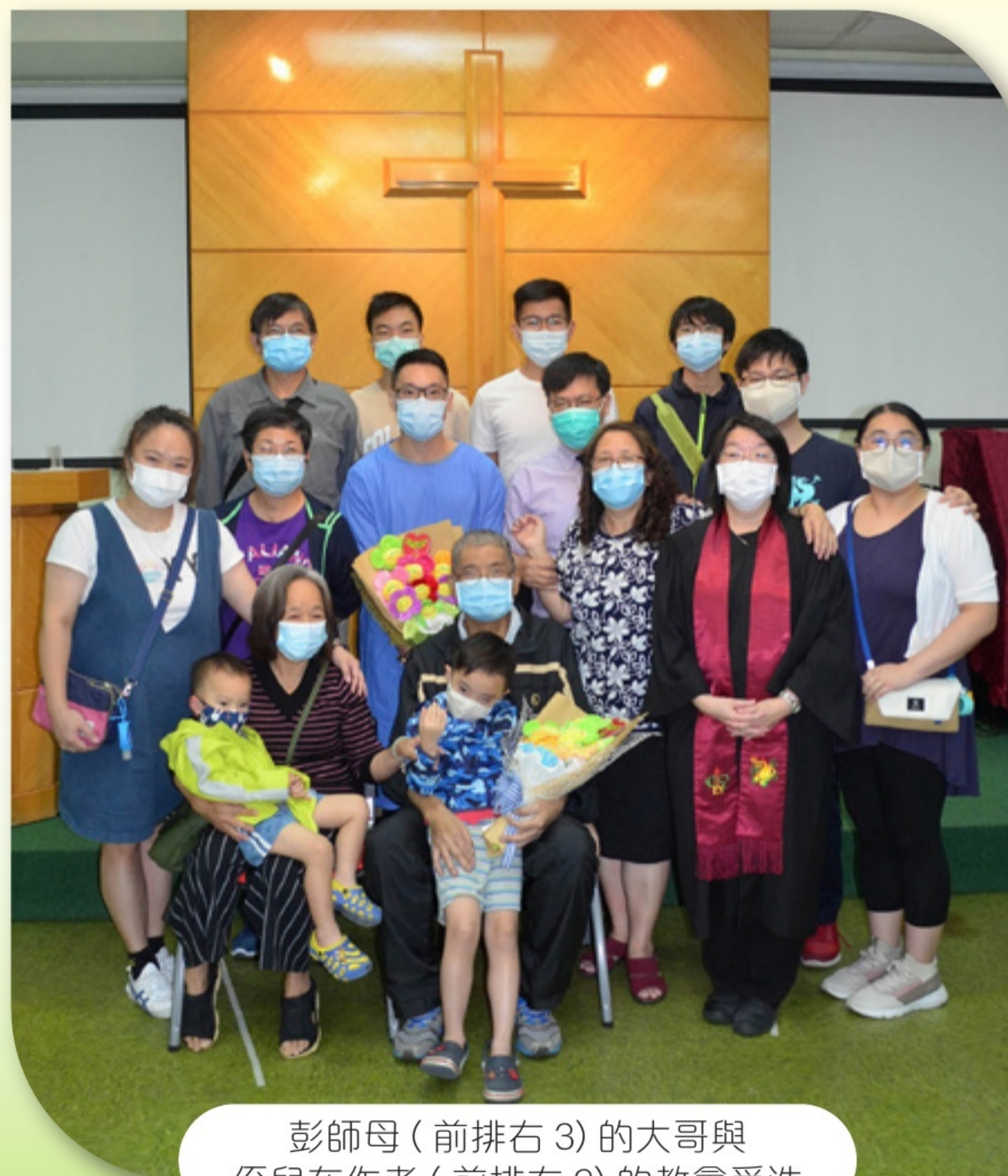
彭師母（前排右3）的大哥與侄兒在作者（前排右2）的教會受洗