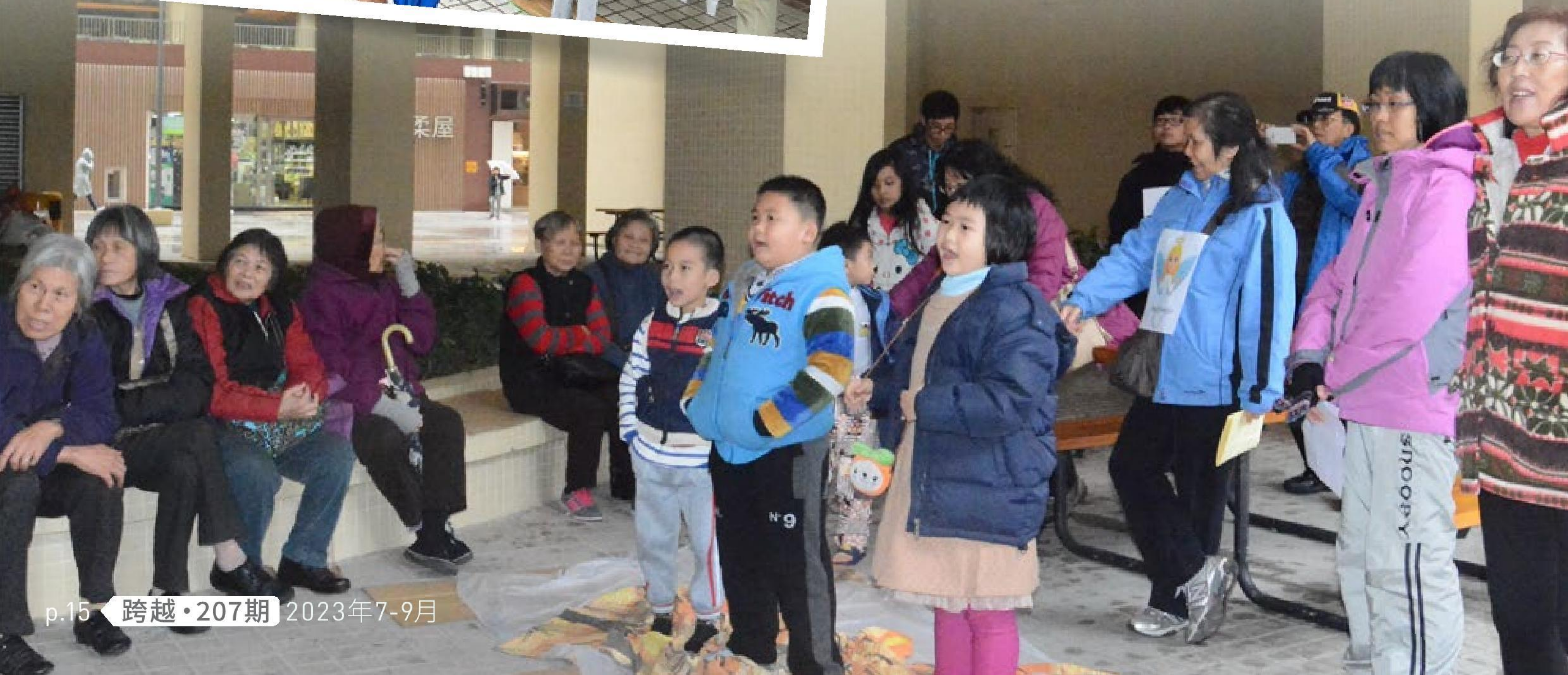
▼ 聖誕兒童佈道會，長者也是座上客