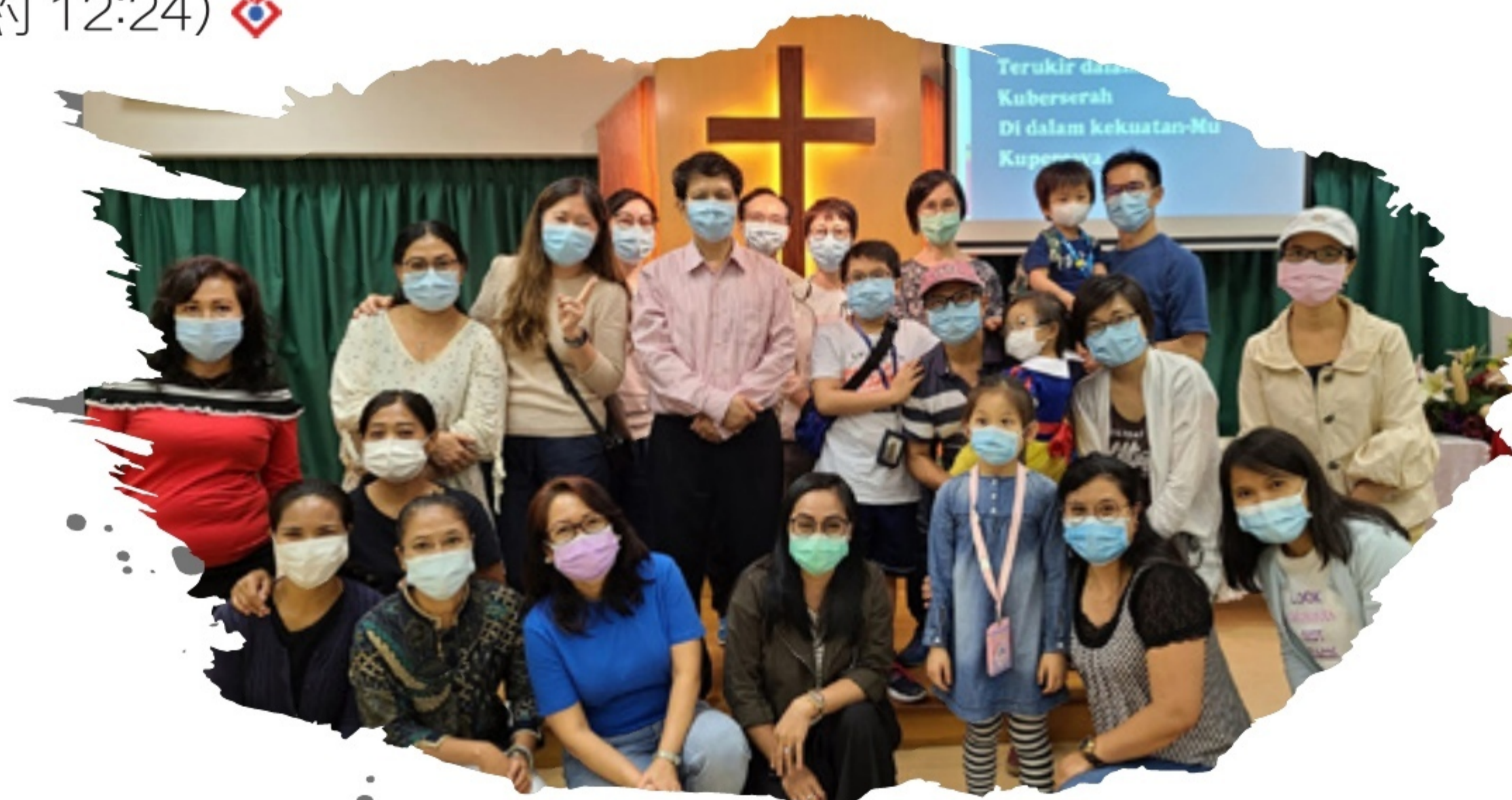
北角站：宣道會印尼信心堂的牧者是從馬來西亞來的宣教士