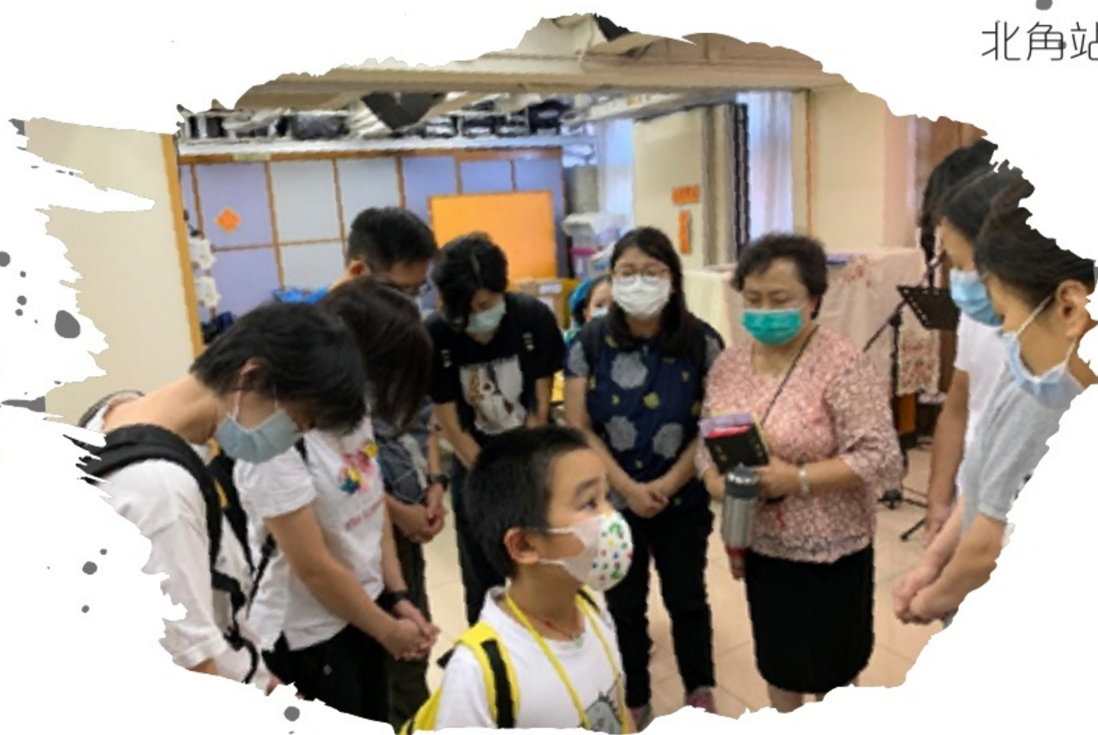
九龍城站：宣道會泰人恩福堂牧者為隊員祝福