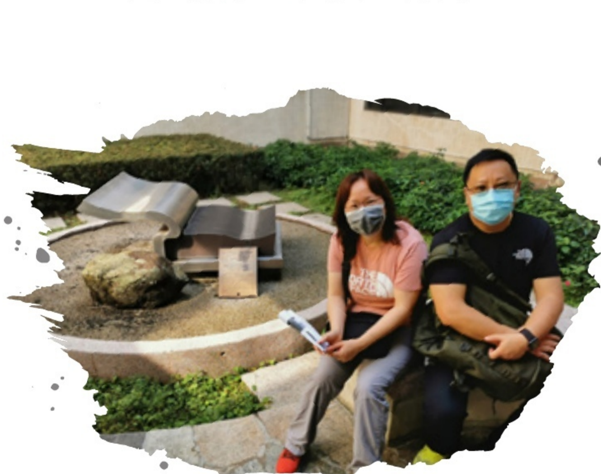
將軍澳站：靈實醫院鎮院之石