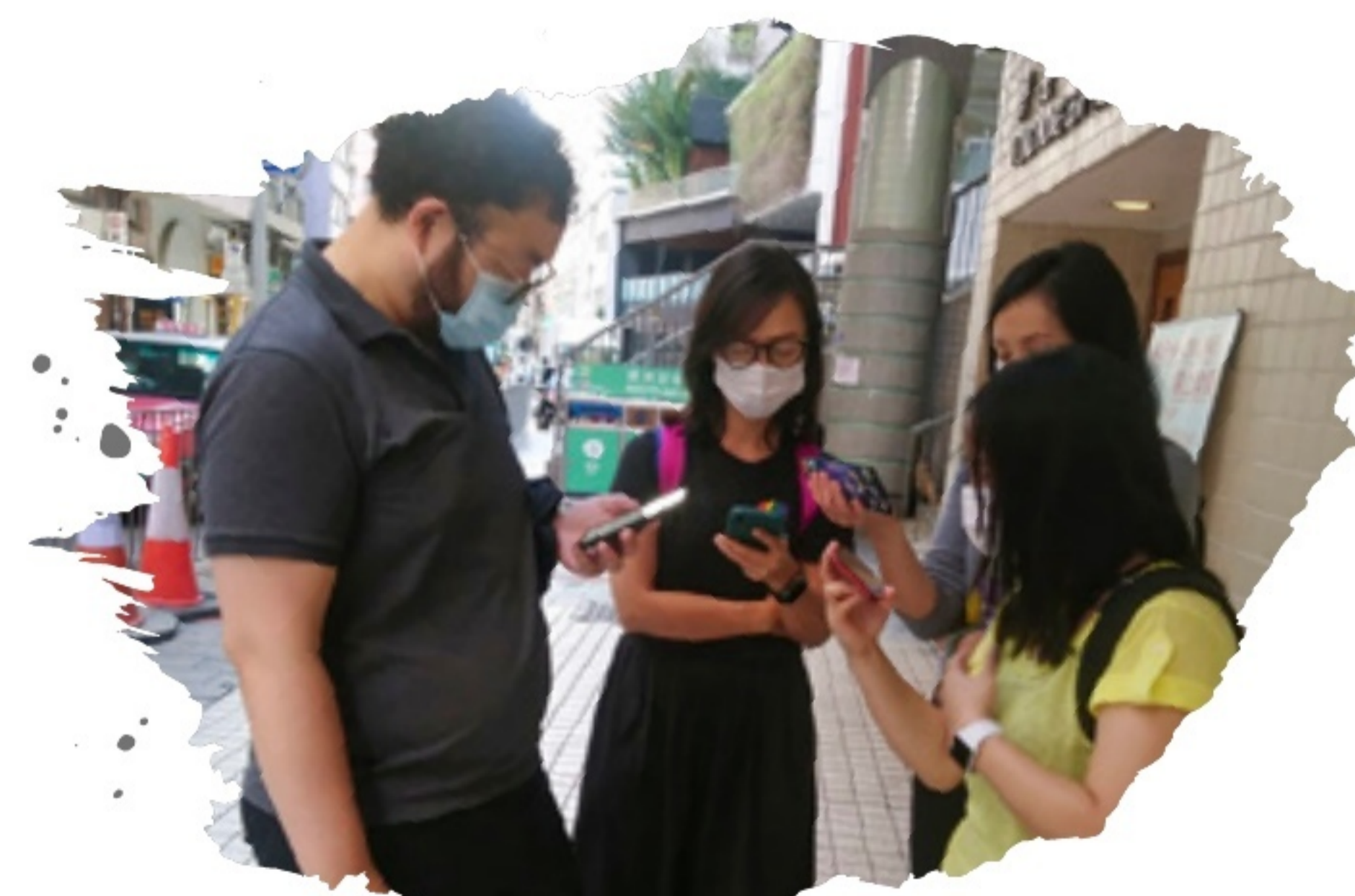
中環站：歷史最悠久的香港浸信教會