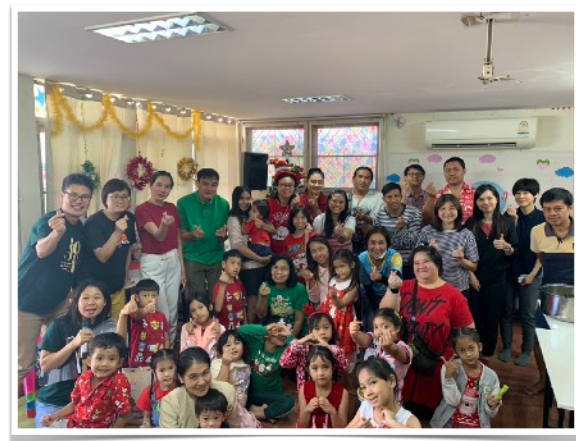
證恩堂短宣隊支援教會聖誕事工（幼稚園教學及語言班慶祝會）