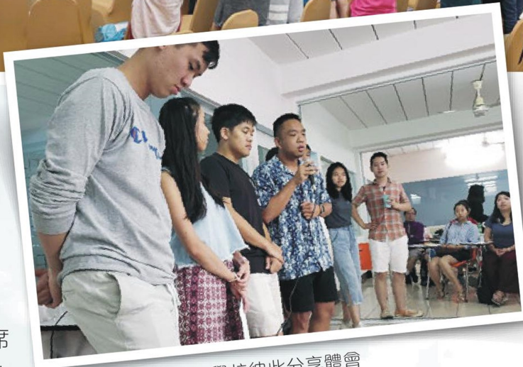
3隊集合在曼谷語言學校彼此分享體會

往後3日，大會編排了不同的聚會，包括：泰國文化簡介、祈禱工作坊、聯合研討會、宣教分享、營商宣教工作坊、小組分享交流等。盼望藉着不同的聚會內容，讓青年人更加深入了解普世宣教的需要和策略，並透過分享及交流，鼓動和激勵他們的宣教心志。