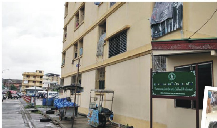
▼ B2 隊參觀穆斯林社區