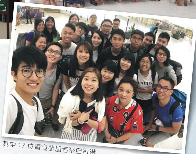
其中 17 位青宣參加者來自香港

最後一天，3 隊集合於曼谷語言學校，彼此分享過去的經歷和體會，例如：最難忘、最感動和最意料之外的感受。不同的青年人，有着不同的文化、背景和信仰歷程，但此時此刻，卻懷着一樣的心志與熱誠！