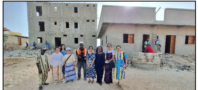
建築團隊非常盡心建造，工程進度理想，大樓(圖左) 7 月起開始門窗的安裝。👍 (攝於 6 月 28 日)