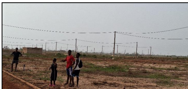
朋友 3 個兒子送補習完的鄰家女孩回家。他們慢慢走，邊走邊玩。除了功課上的栽培，也有生活上的愛心照顧和付出，弟兄一家對鄰舍的愛，與這一片荒蕪的地方，形成強烈對比，我深深折服和感動。👉