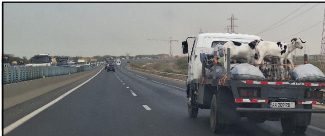
待宰的羔羊正被送往首都，另一邊長長的車龍載著從首都開來，載滿回鄉過節的人。(攝於 6 月 15 日宰牲節期間。)