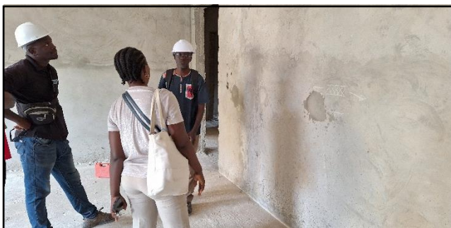
建築團隊和合作伙伴與我們的本地同工，在大樓內商討幼兒園內部的建築需要。👁️