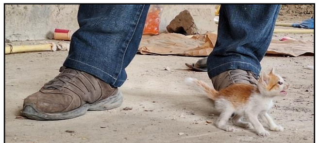
巴掌般小的初生貓兒 在工地外出現，牠跟著我們走進工地，不斷向我們發出求救的喵喵聲，同工說牠的父母被狗咬死了，沒人收留。人會被「自然淘汰」，貓兒更是如此..... 😞

奉獻支持： 支票、現金入數或轉帳至國際活泉基金會有限公司 (Lisac International Ltd)