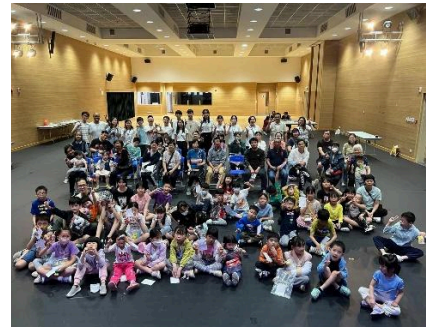
▲ 復活節親子同樂日