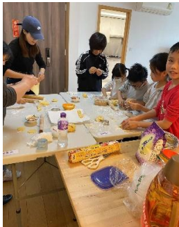
▲ 親子齊做油角迎龍年

另一方面是家庭事工，我們仍沒有家長及兒童的穩定成員，所以每次舉辦親子或家長活動，我們都懷著戰戰兢兢的心情，不知到時有沒有對象來參加，然而上帝的恩典永遠夠用。正如我們2月3日舉辦的「親子齊做油角迎龍年」，參加的只有2個家庭及4個獨自到來的小朋友。雖然人數不多，但大家都很開心和齊心做油角，做手工及唱基督教的新年詩歌。在3月23日下午3:00舉辦的一個講座中，到了下午3:30仍渺無人跡；但在我們最擔心的時候，神卻親自帶領3個有子女的家庭到來，其中兩位家長和子女竟然參加我們於家長講座後的第二個星期六所舉辦的家長小組！