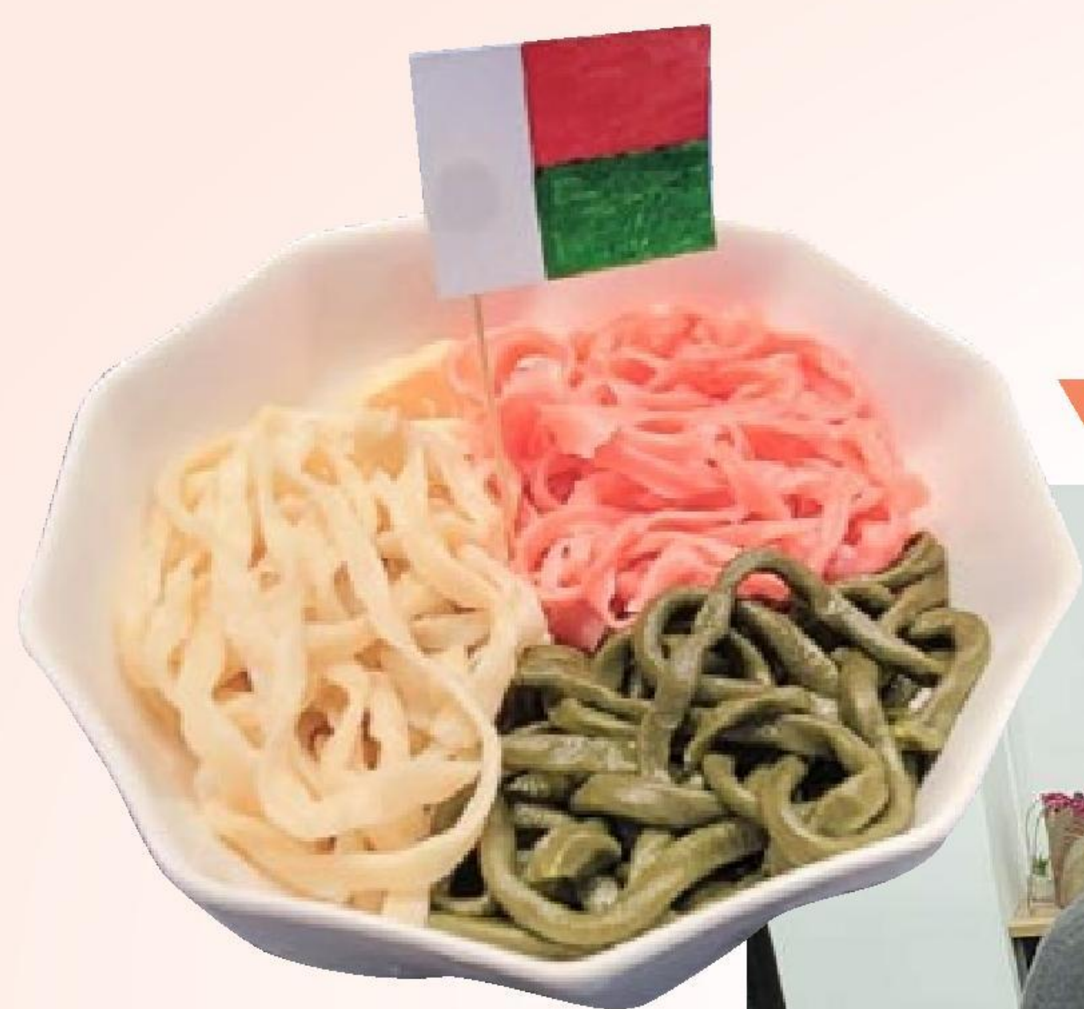
▼ 馬島國旗手工麵工作坊

咖啡室又與京城堂在貧民區的脫貧計劃合作，策劃如何銷售貧窮婦女製作的手工藝品，並為其設計產品包裝，在咖啡室擺設和寄賣。盼望藉此幫助她們自力更生，激勵顧客的愛心，並透過這些作品去分享創作者的生命見證，讓顧客看見神在創作者生命中的工作。