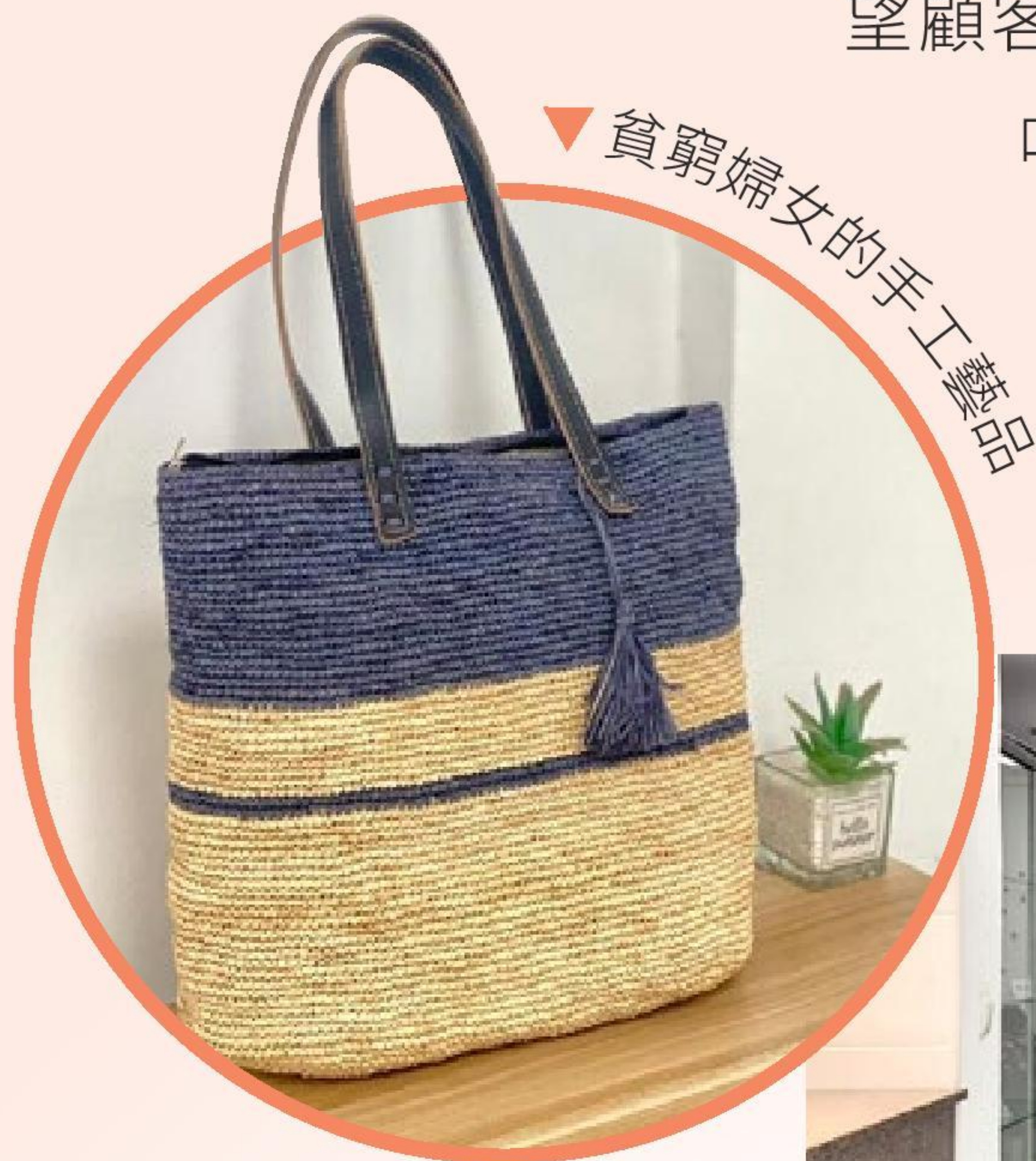
▼ 貧窮婦女的手工藝品