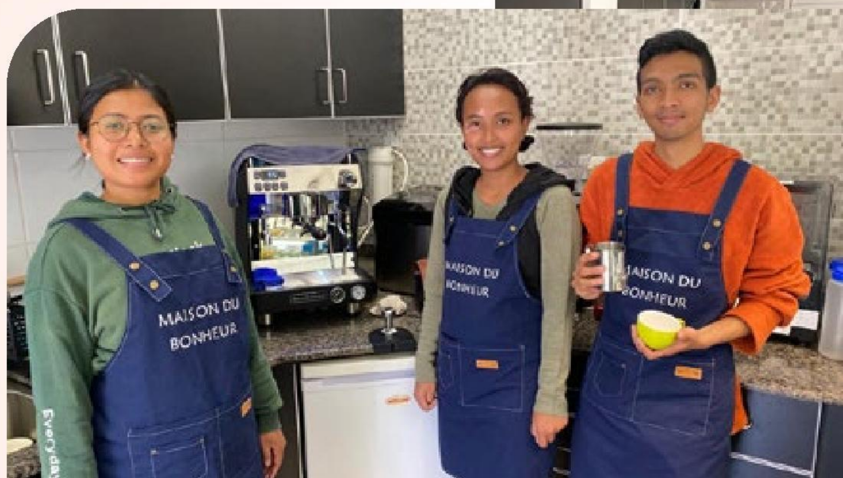
▲ 咖啡室同工(左、右)與實習生(中)