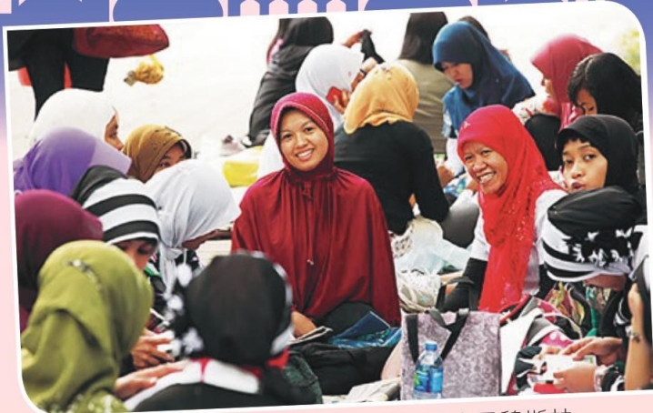
深受港人僱主歡迎的印尼傭工，其中不少是穆斯林。