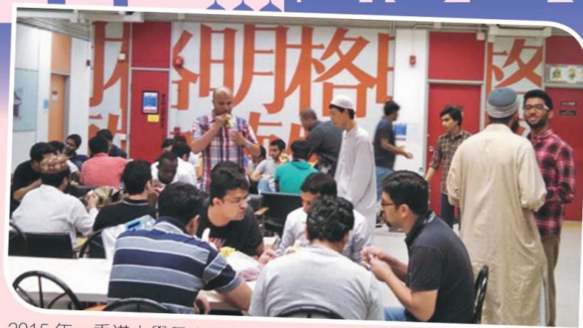
2015年，香港大學學生會穆斯林學生協會曾於校內舉行齋戒月活動。