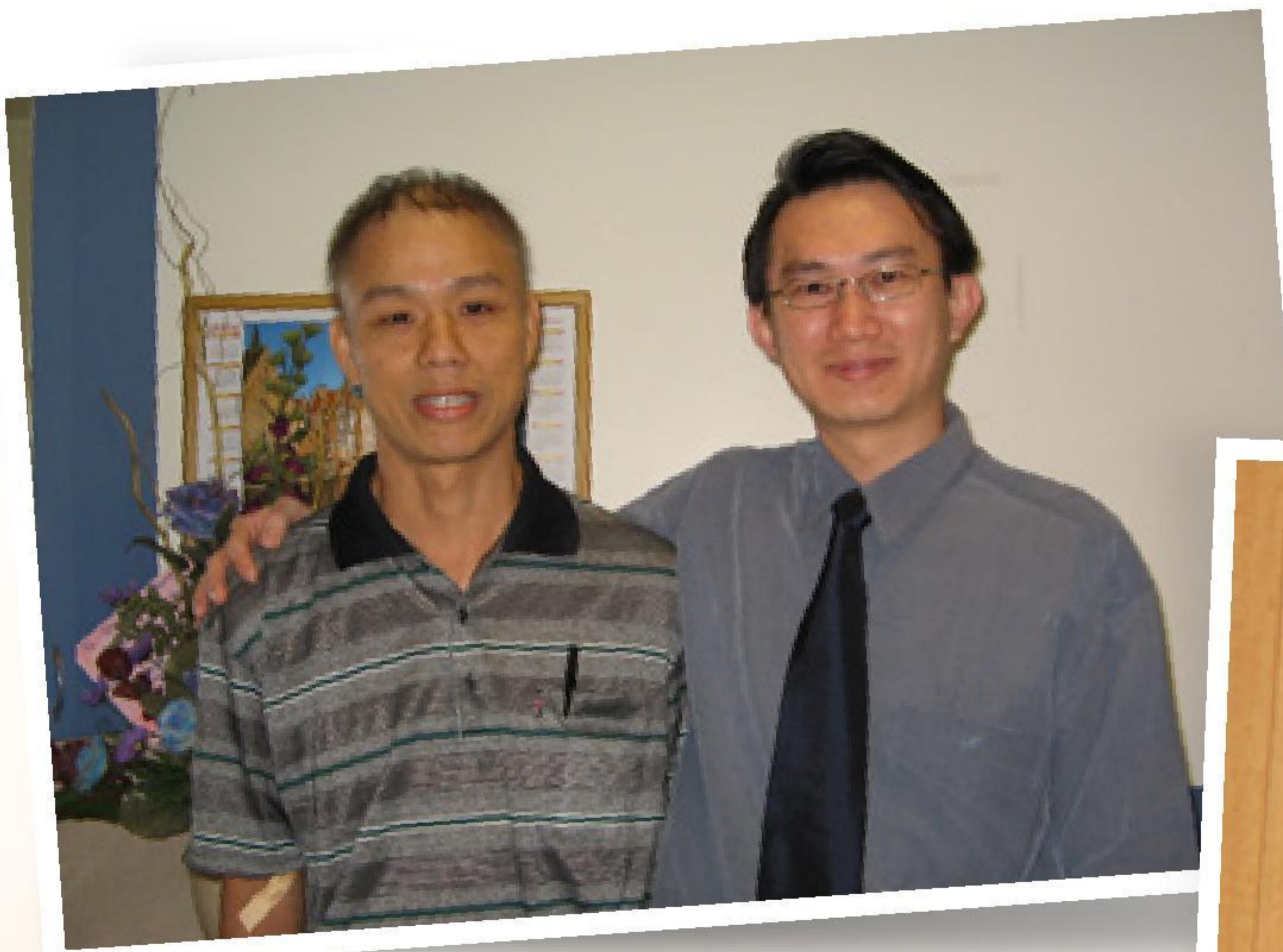
作者(左)2005年首次化療後 與主診醫生合照

2005年，我患上血癌並向上帝許願，求祂給我生命，讓我可以全時間地服侍祂。結果，上帝應允我的祈求。在骨髓移植後，我便去接受神學裝備，於2014年以傳道人的身份服侍祂。但在這之前，我從來沒有想到自己會成為一位牧師！