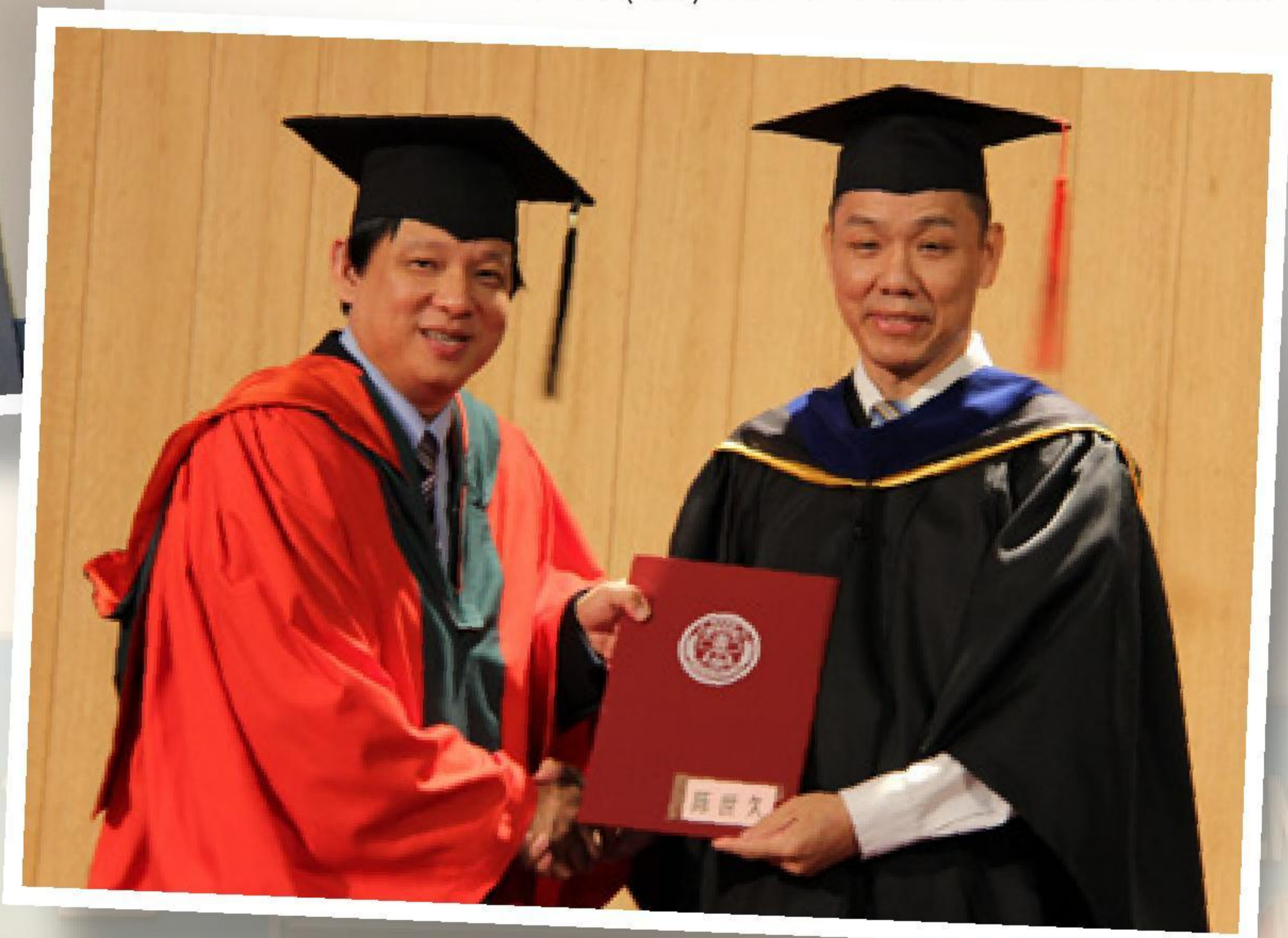
作者(右)2013年就任蒲種堂傳道