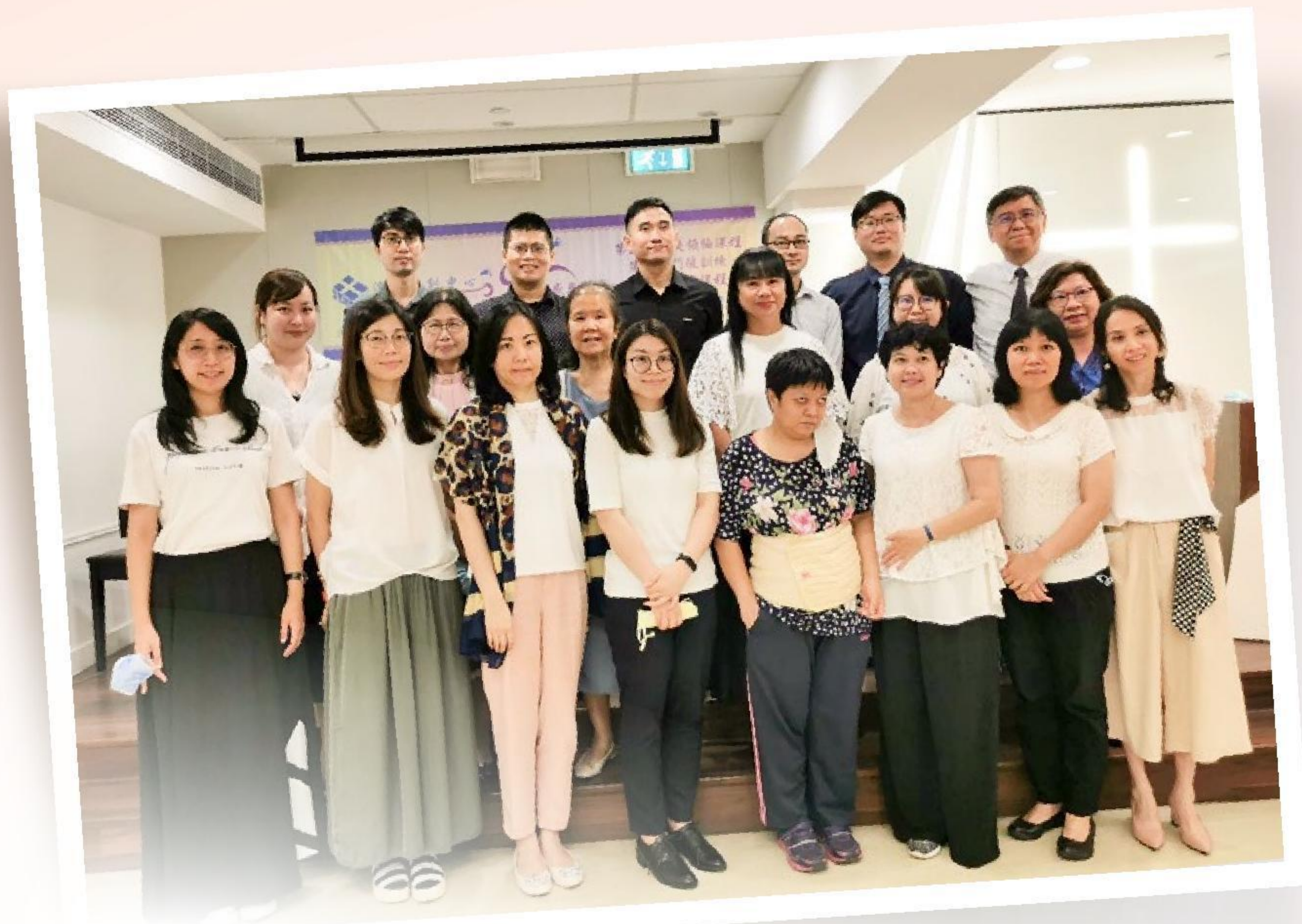
▲ 澳宣培訓中心歷屆門訓領袖學員(部分)與導師合照

擔任教會的福音幹事，希望更貼身地培訓她們，以生命影響生命，同時讓她們有更多機會參與和熟悉教會的事奉。