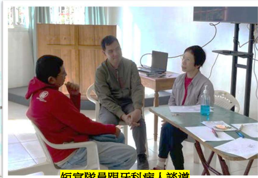
短宣隊員跟牙科病人談道