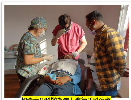
加拿大牙科隊為病人進行牙科治療

所以，無論我們在前方抑或後方，只要有感動，然後有行動，那怕是一個祈禱、一個奉獻、捐贈一件物資、參與一次短宣，神必定悅納使用!