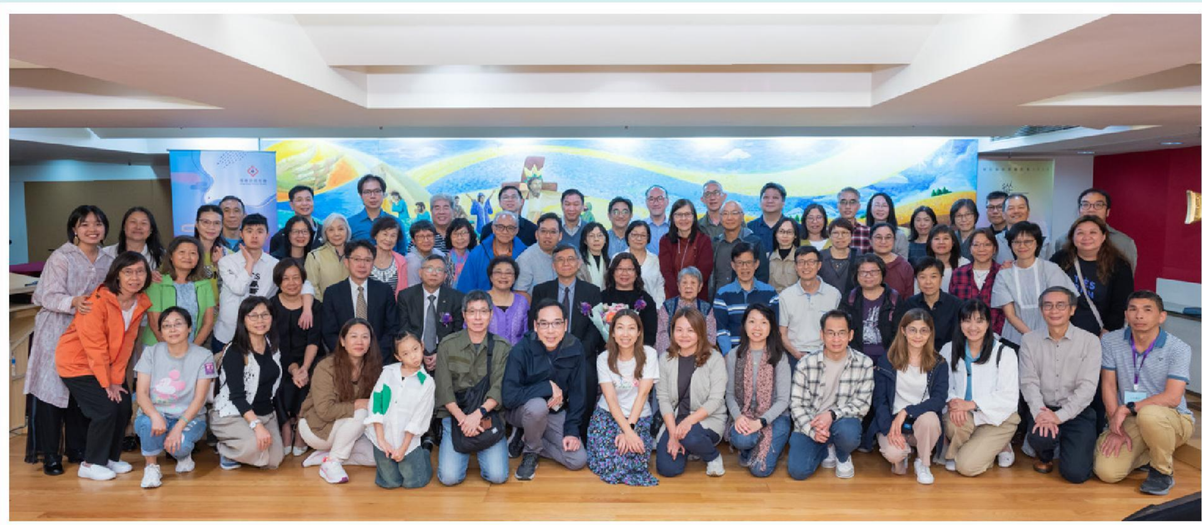
▲ 宣道會屯門堂系列同工及肢體

「第一階段是在香港牧會，當時我主要參與推動差傳教育，帶領短宣隊到宣教工場體驗，知道工場有不同的需要，並學習差傳認獻，但那時抱着旅遊心態，比較『不落地』。