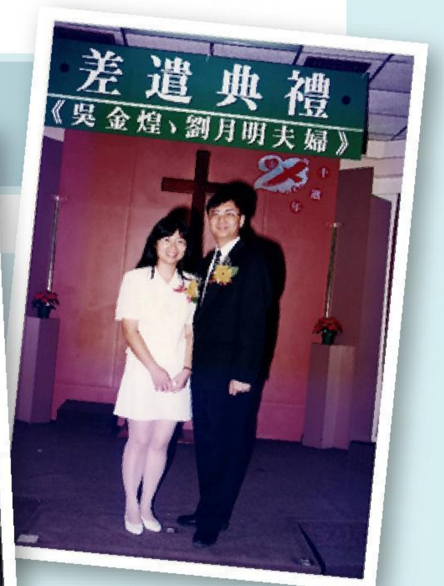
1996年被差往台灣高雄宣教