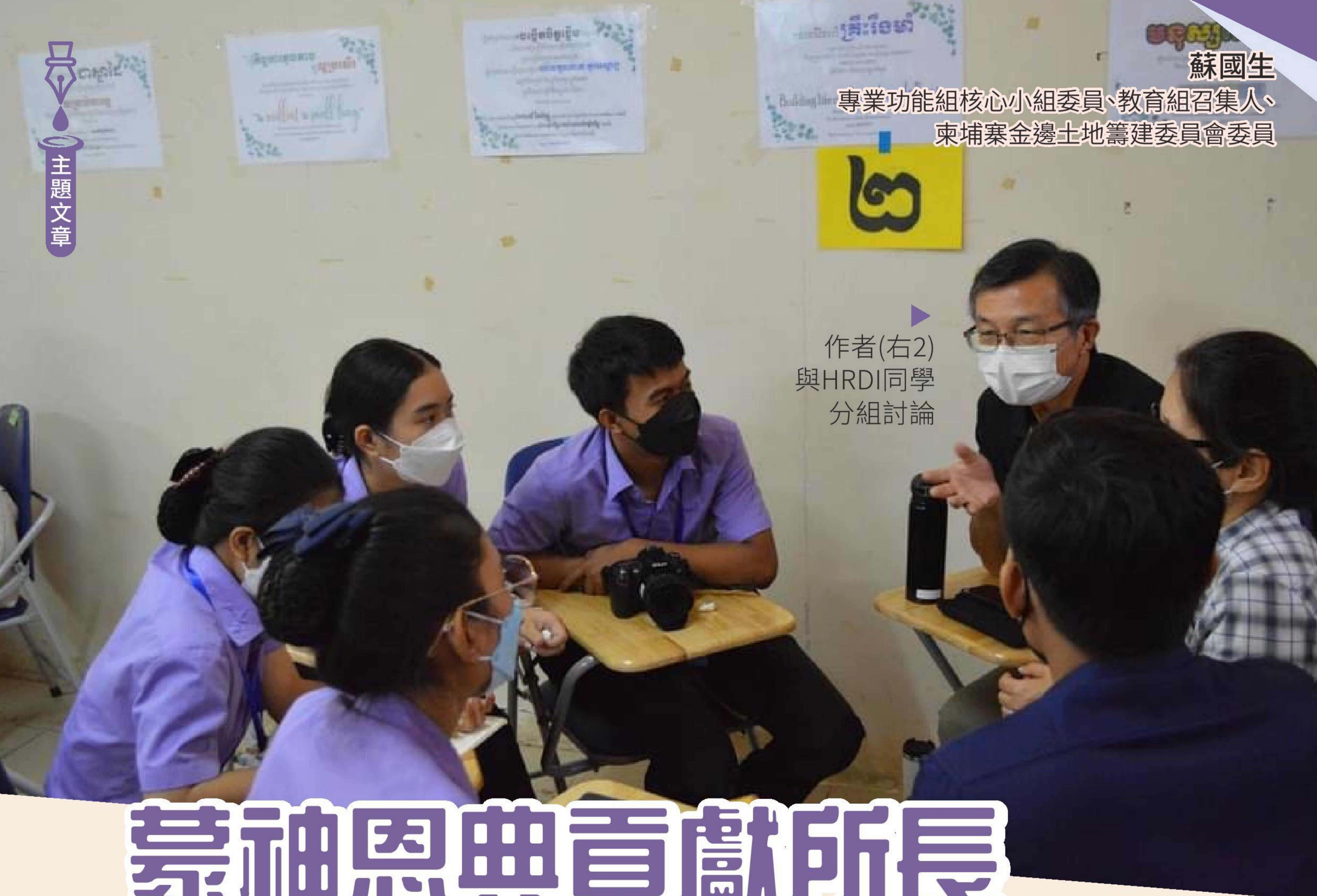
▶ 作者(右2) 與HRDI同學 分組討論