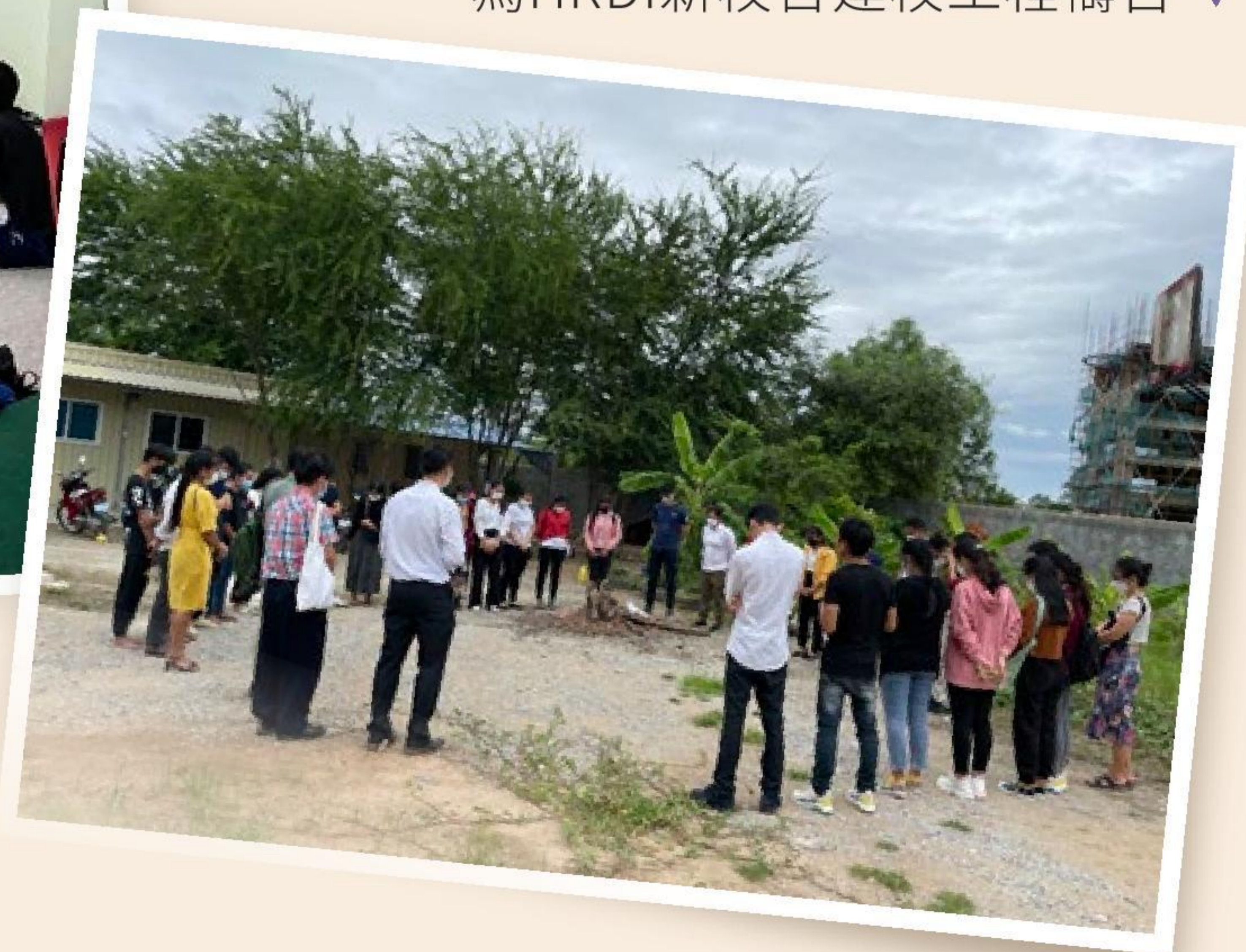
為HRDI新校舍建校工程禱告 ▼