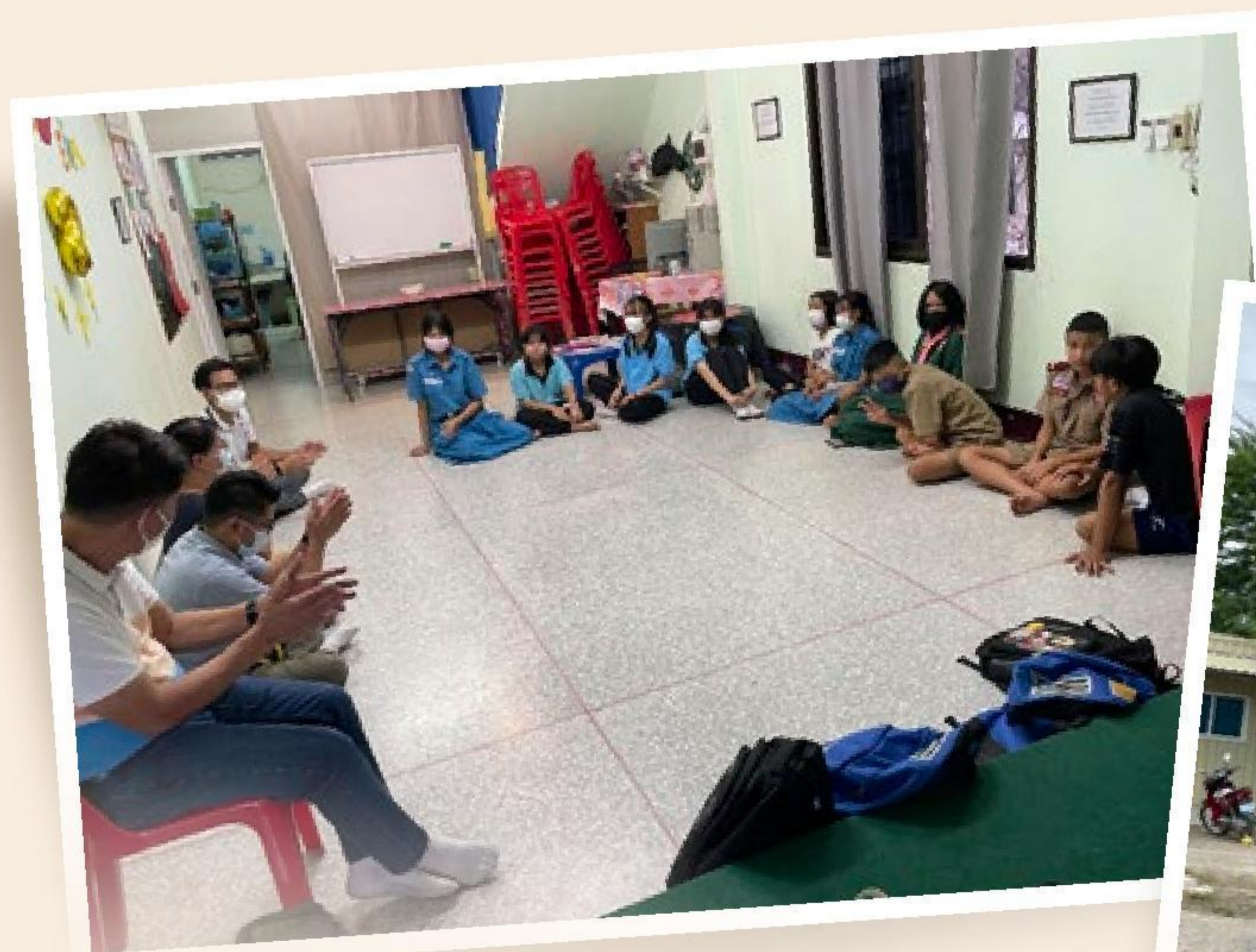
▲ 泰北莫拉肯教會的英語班