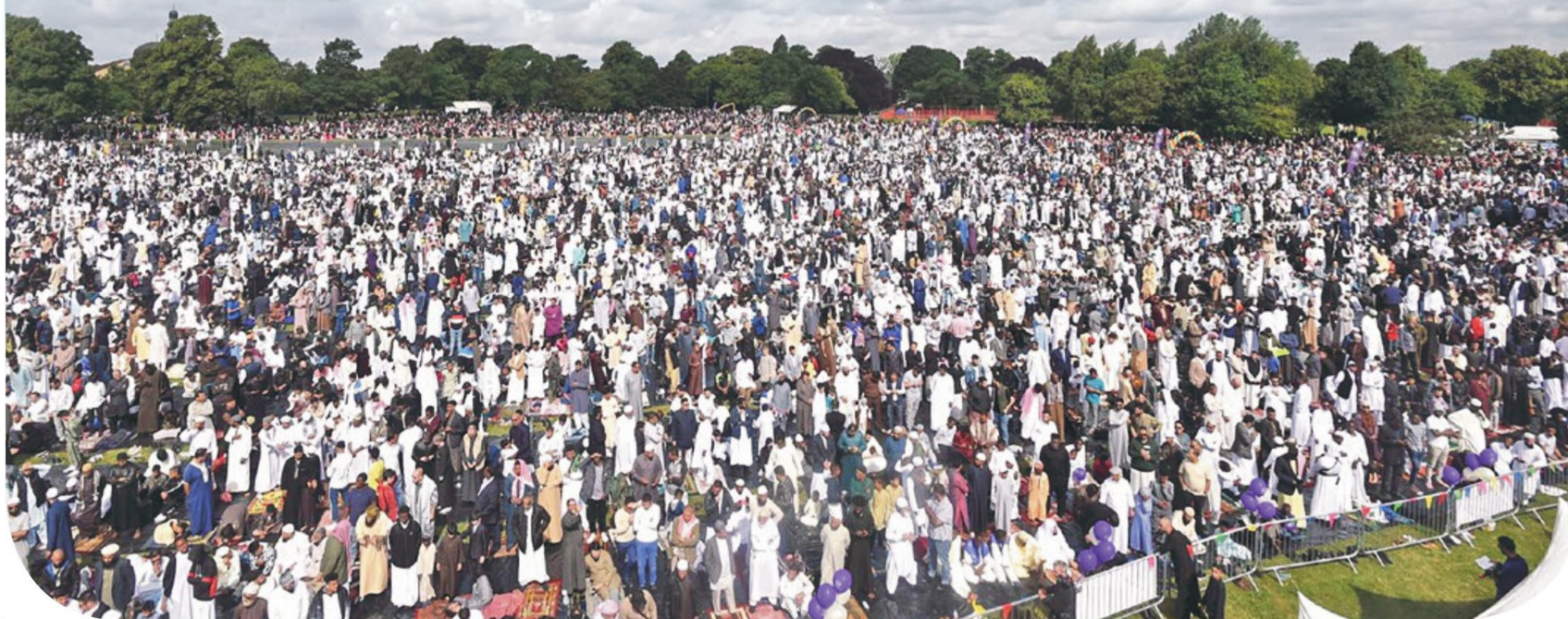
伯明翰公園開齋節慶祝活動