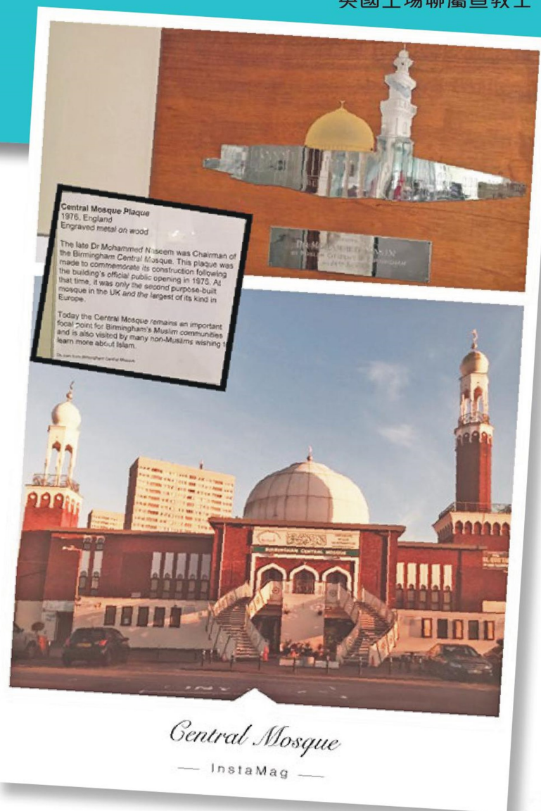
伯明翰第一座清真寺早於 1975 年建立

我們曾經有幸參與有關本地穆宣工作的交流會，才得悉這城市已經有近 300 間清真寺！數量之多，是我們沒法想像的。雖然情況令我們擔憂，但在交流會中聽見幾位穆斯林歸主者的見證，他們的生命告訴我們，神仍然使用不同的信徒與事工作工，讓穆民認識基督。這也鼓勵和喚醒我們，要為這城的人民禱告、守望，更要為主作見證，被主所用。 1