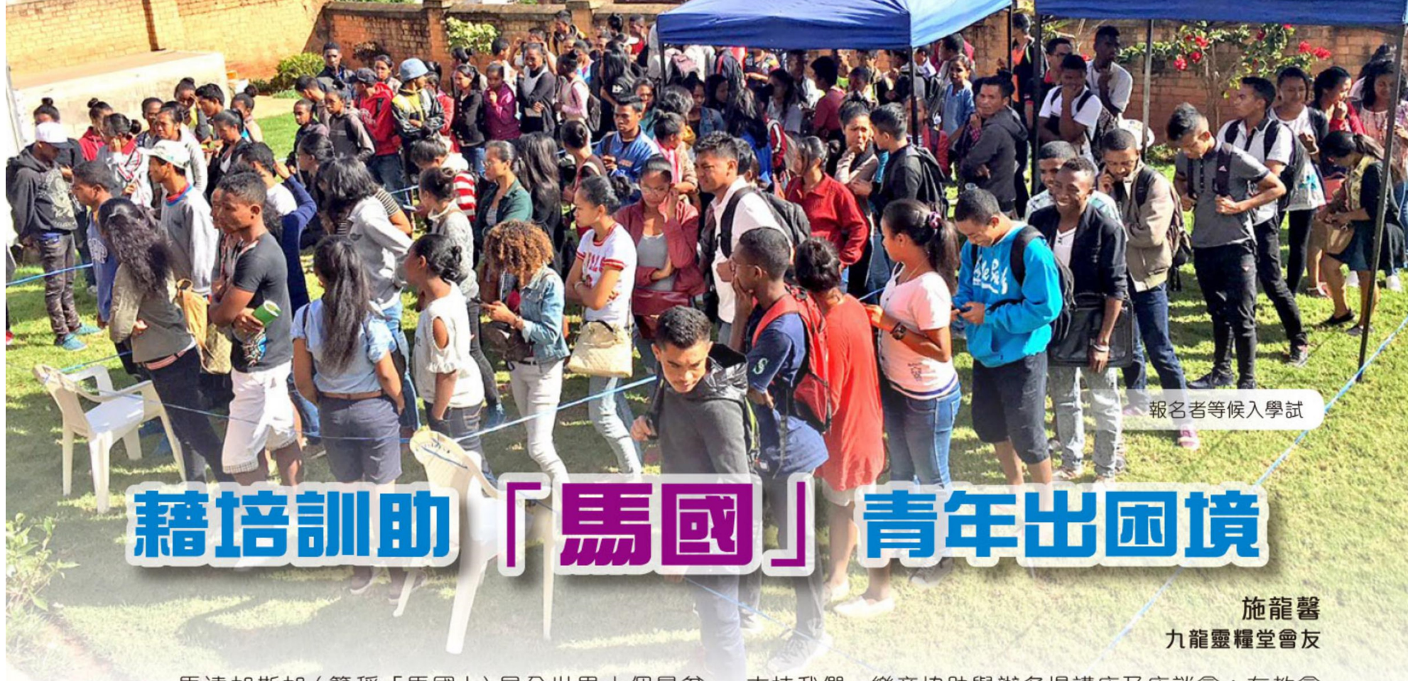
報名者等候入學試