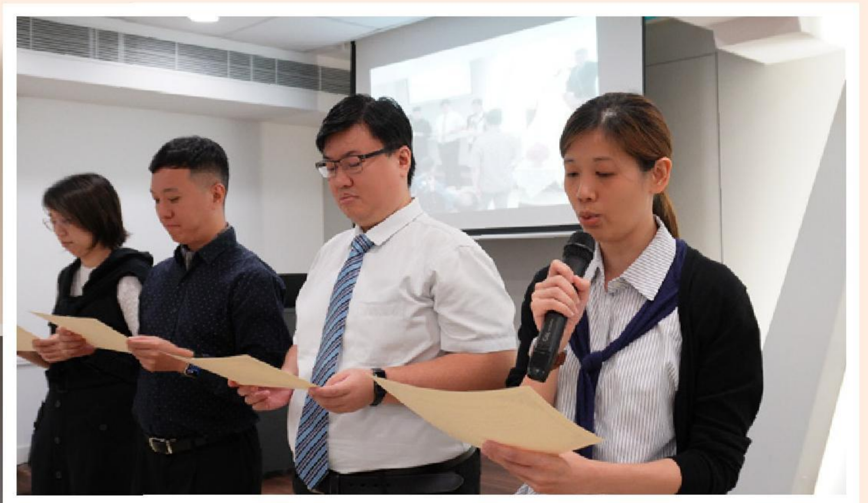
▲ 首屆執事宣誓就職