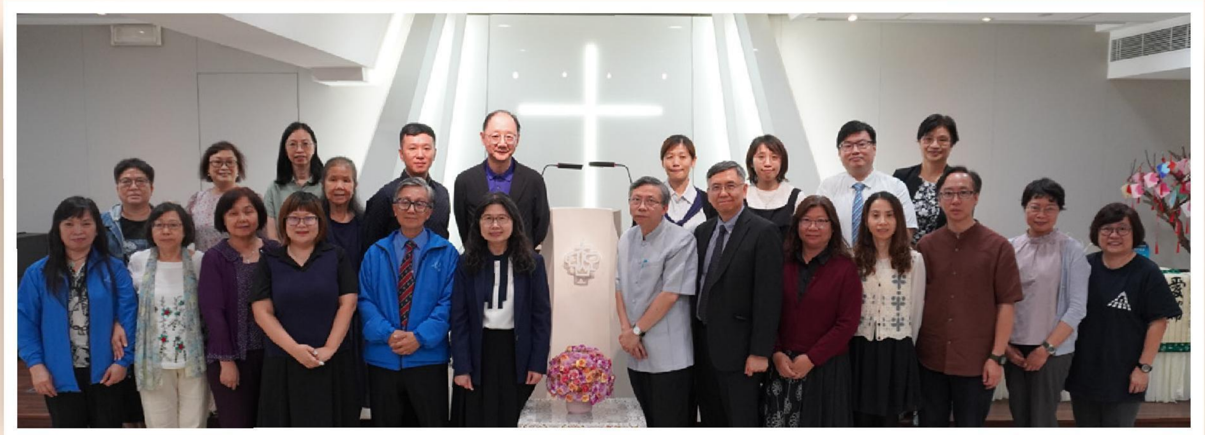
本會董事、同工、澳門宣道會同工及 ▼ 宣道中心堂執事