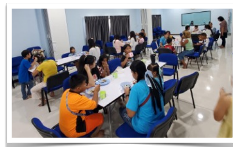
8月中母親節主日情況：講道、玩遊戲，愛筵，小天使洗碗