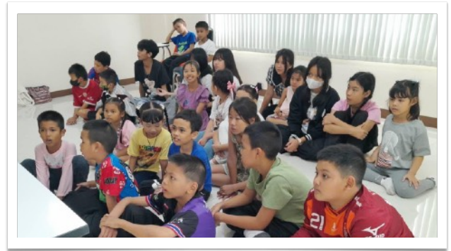
兒童主日學兩班（初小及高小）