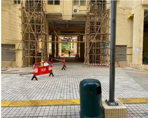
之前申請的休憩處

絡有關部門時，職員告知工程部人員可以預留出入位置給予我們舉辦活動，因為維修的位置是外牆，休憩處是可以使用的！我們知道這安排都不是理想的，然而這確是不需取消嘉年華會的唯一的方法！願主保守一切！