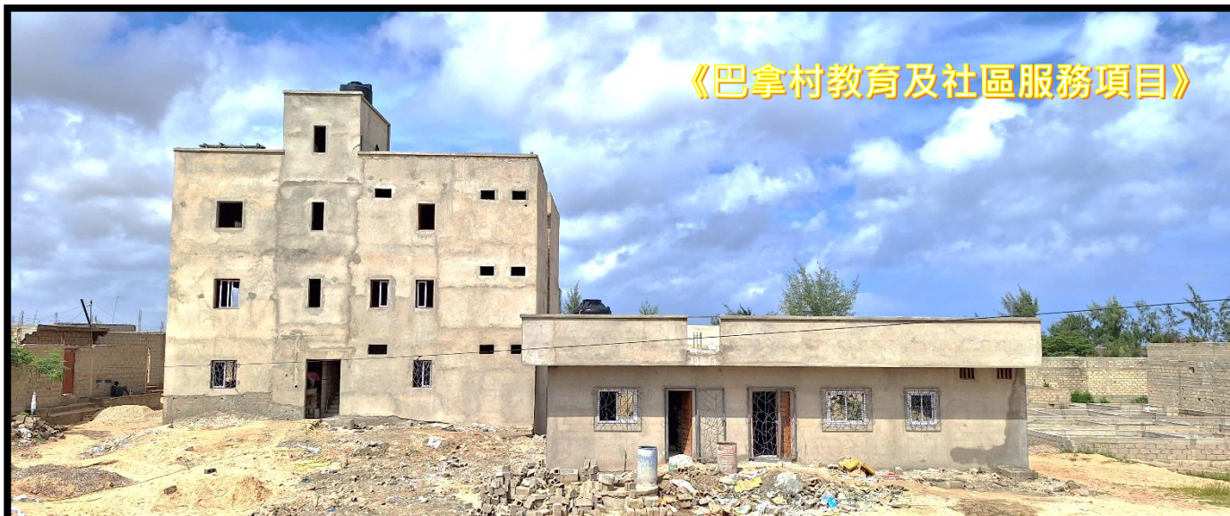
《巴拿村教育及社區服務項目》