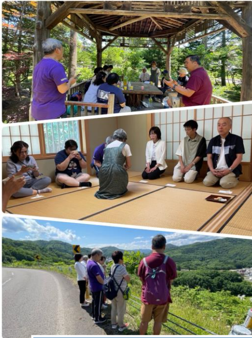
西興部戶外崇拜、茶道體驗、行區禱告