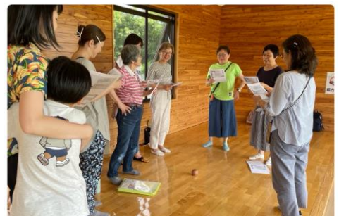
Joyful Ladies 戶外聚會

自2009年RW獻身讀神學、2014年被差遣到日本服事，這十多年（未計算母會在我們還初信時栽培牧養的年日），母會在各方面都是RW最強的支持後盾！可以說每次母會來探訪時，Winny 都會哭一場，Ricky 都會感到失落，因為RW可向所愛所信任的弟兄姊妹盡